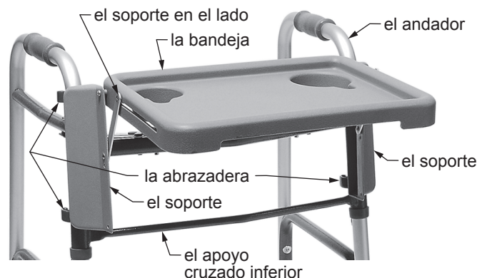
603900A Bandeja para Andador